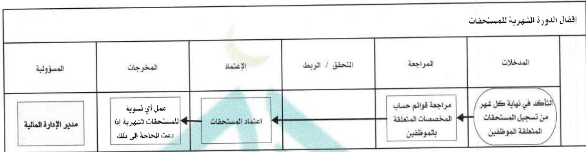
شكل رقم / ٥

يوضح المخطط البياني التالي ( شكل رقم ٥) طريقة تسلسل العمل لإقفال الدورة الشهرية للمستحقات: